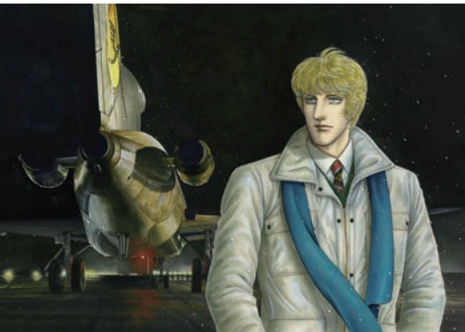
「Z-ツェッター」©青池保子/秋田書店