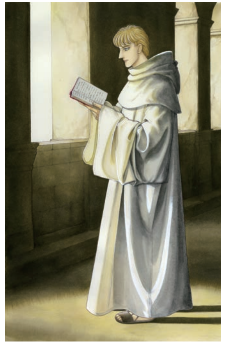
「修道士ファルコ」©青池保子/秋田書店

A world of beautiful artwork from 'Eroica' to 'Falco'