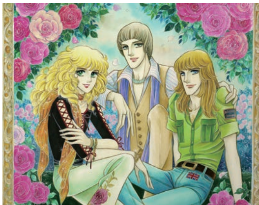
「イブの息子たち」©青池保子/秋田書店